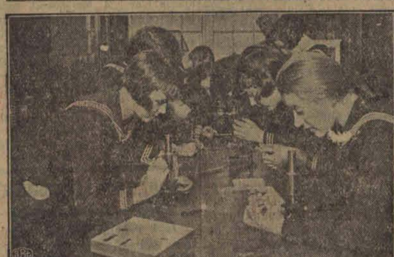
Gimnazjum żeńskie p. Miklaszewskiej jest jednym z najlepiej wyposażonych zakładów średnich naszego miasta. Na zdjęciach widzimy uczennice przy praktycznych zajęciach w gabinetach fizycznym oraz lekcje przyrody przy pomocy mikroskopu.