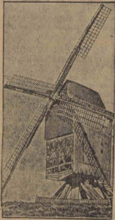
Najstarszy wiatrak Europy znajduje się w Mauvinage w Belgii. Ostatnie burze uszkodziły ten zgrybiały budynek, mający już 650 lat. H