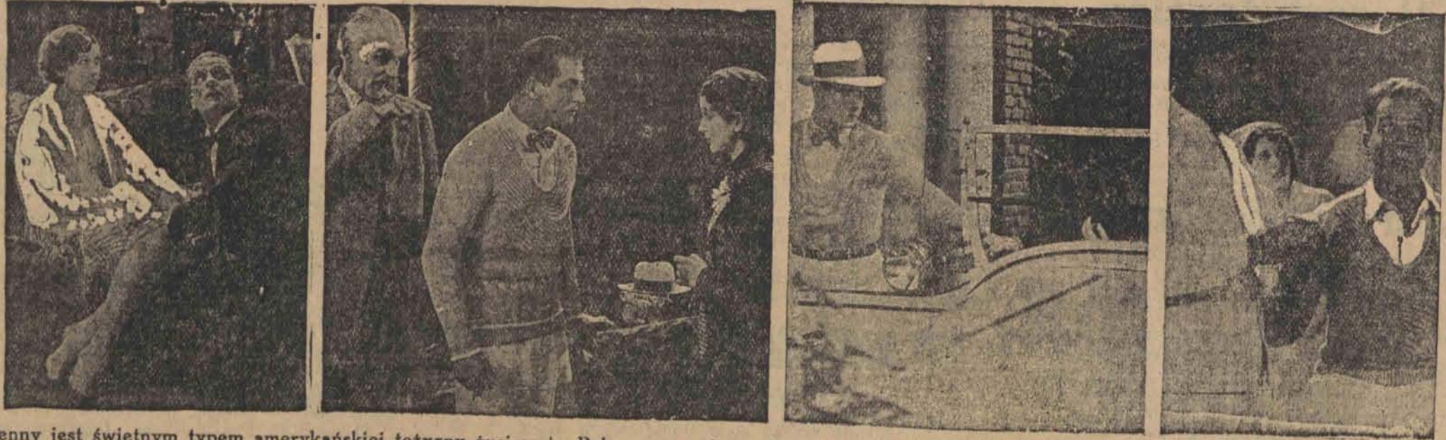
Reginald Denny jest świetnym typem amerykańskiej teatru życiowej. Pełen werwy i temperamentu łączy on w sobie zalety sportowca z niezwykłym talentem aktorskim. Najnowszy swój scenariusz „Wyścig o szczęście” wyposażył w rozmaite świetne pomysły, dając sobie temsamem możliwość wykazania swego talentu i brawury.