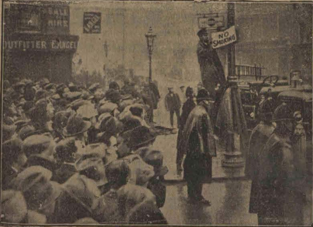
Wywieszenie plakatu policyjnego: „Nie wahać”