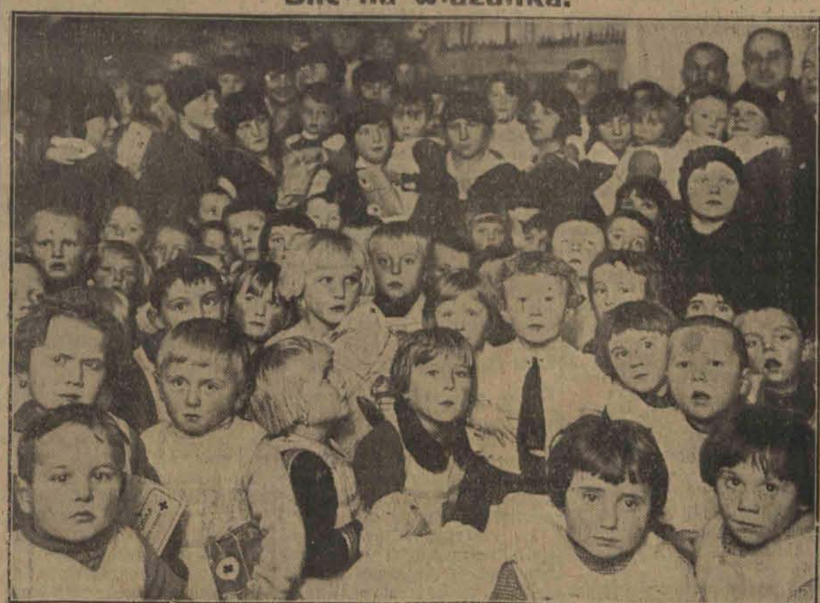
Choinka dla biednych dzieci w ochronce na Chojnach.

Pożar wielkiej fabryki. Tytoń w morzu ognia. W Gałacz, w fabryce tytoniu Bradea wybuchł w nocy olbrzymi pożar.