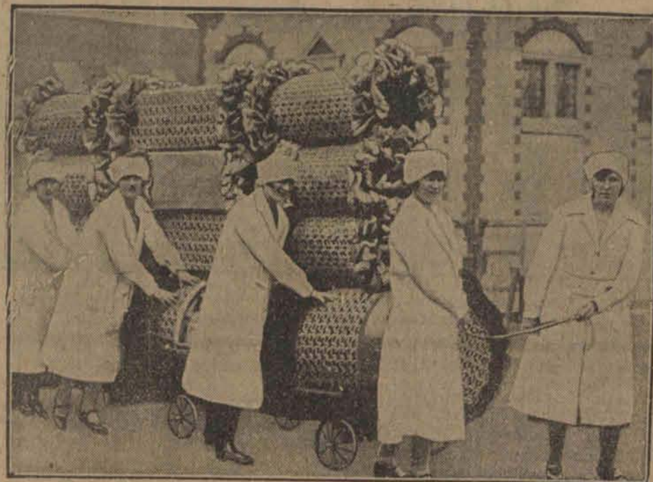
Cukiernicy londyńscy wpadli na świetny sposób. Mianowicie rozwożą ciasto po domach na specjalnych wózkach, które obsługują dziewczęta.