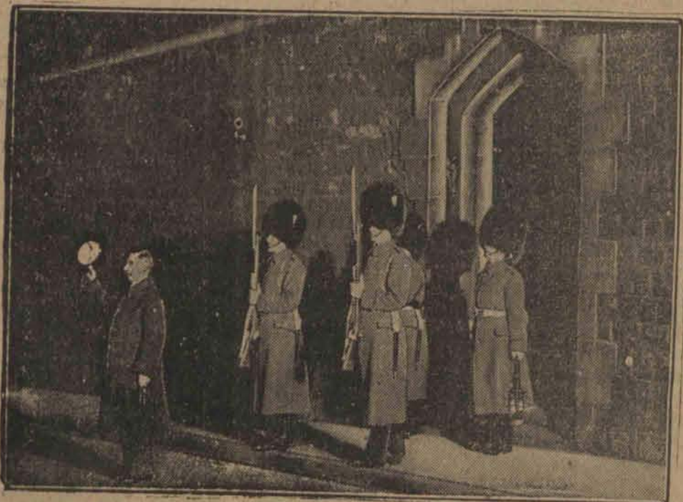
Gwardia króla Jerzego na warcie. W myśl tradycyjnego zwyczaju mistrz ceremonii tegna zasypiającego monarchę słowami: Boże zachowaj nam króla Jerzego.