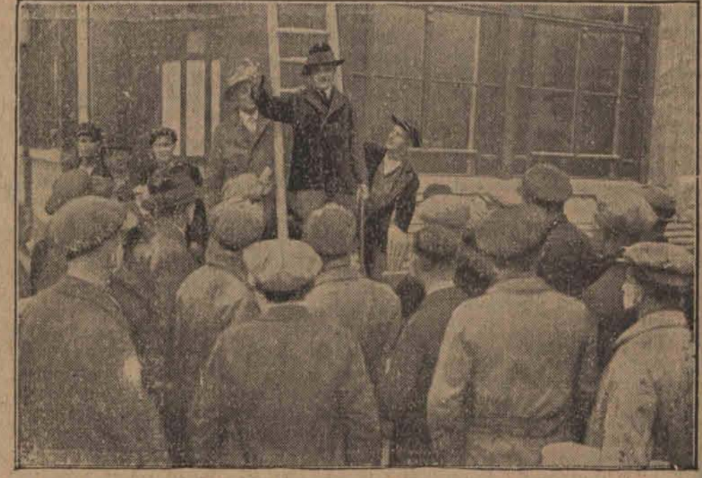
Portugalia słynie z ciągłych zaburzeń i zamieszek politycznych, powodowanych przez agitatorów i przywódców politycznych. Na zdjęciu charakterystyczna scena uliczna w Lizbonie — grupka wiecujących, do której przemawia agitator.