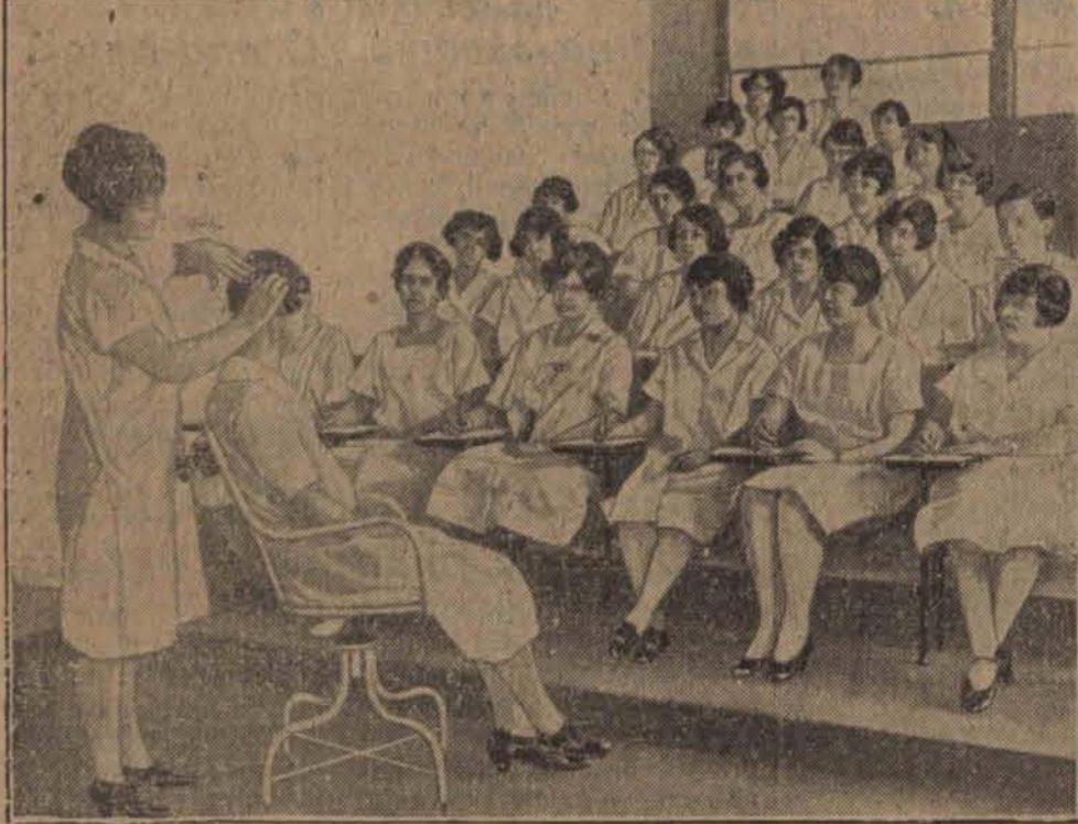
Odbył się ostatnio w Londynie oryginalny konkurs na najpiękniejsze uczesanie główki kobiecej.