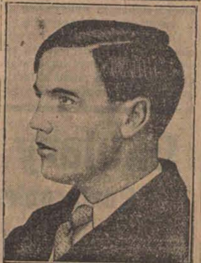
Młody francuski kompozytor Georges Anteil otrzymał pierwszą nagrodę państwową za muzykę skomponowaną do tragedji Sofoklesa „Król Edyp”.

Od kilku już lat w produkcji niemieckiej wyraźnie zaznacza się tendencja w kierunku tworzenia filmów psychologiczno - życiowych, które niestety nie wnoszą nic nowego pod względem technicznych możliwości.