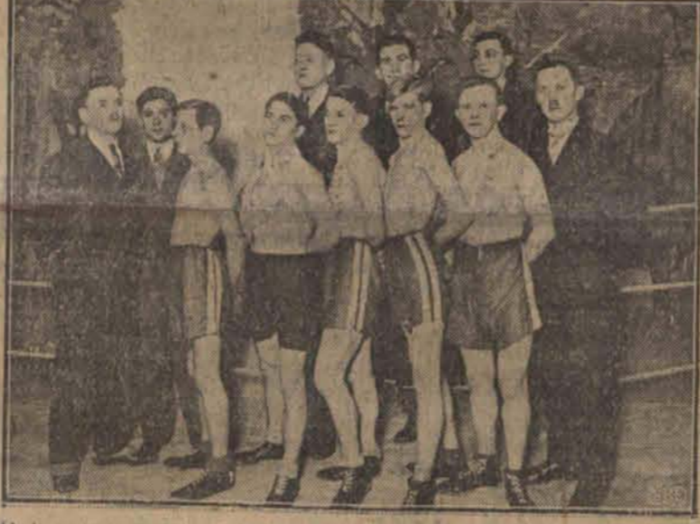
Boks propagują jedynie nieliczne kluby sportowe. Do ich grona przybyła ostatnio sekcja bokserska Scheiblera i Groomana.