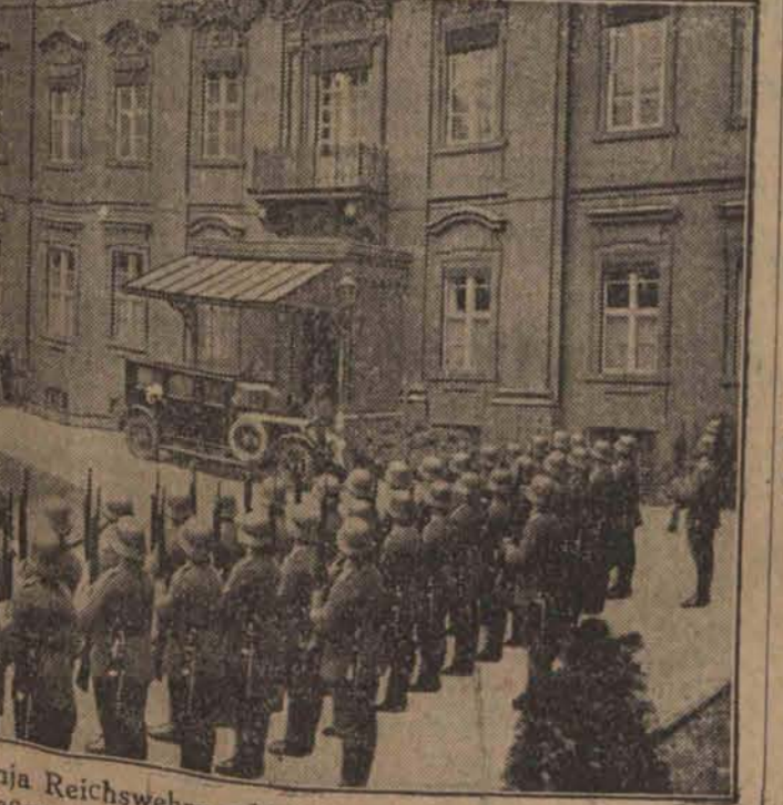
Prezydent Reichshejry oddaje honory wojskowe nadjeżdżającemu posłowi polskiemu ministrowi Knollowi.