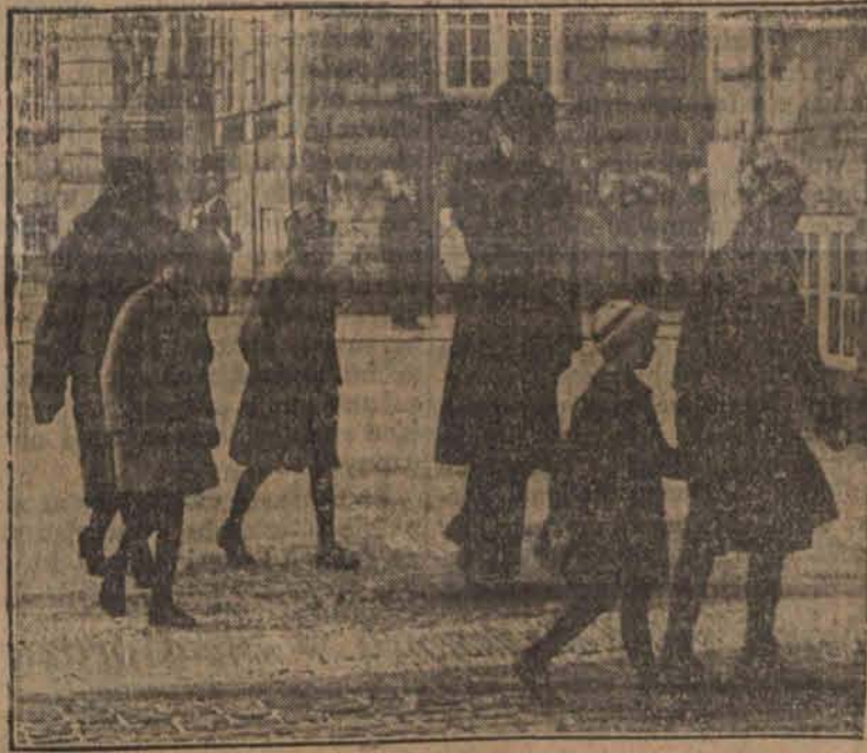
Mamusi, które boją się puścić swe pociechy same do szkoły