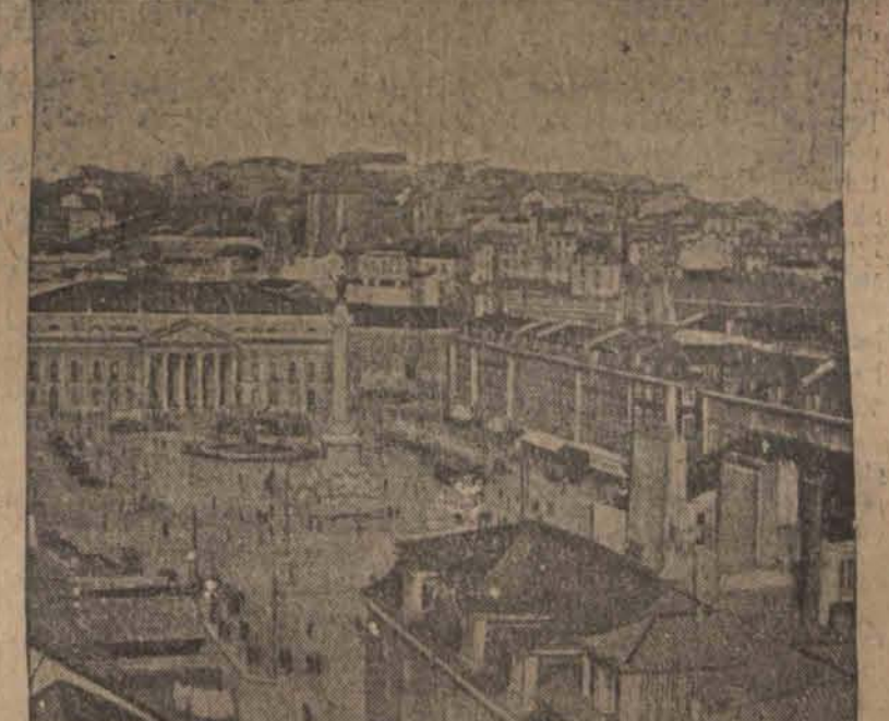
Przepiękny Teatr Rewji, Kino Centralne i Klub Maksyma w Lizbonie spłonęły dnia 29 stycznia doszczętnie.