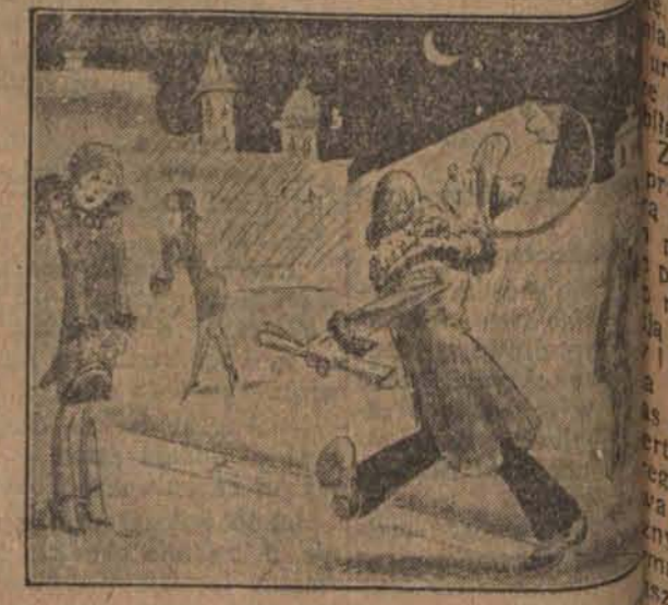
Projekt samooświetlenia aktorów w drodze do domowych pieleszy.