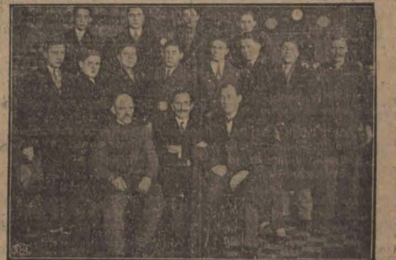
Grupa uczniów szkoły zawodowej Nr. 7 z nauczycielem p. Orłowym na czele w maszynowni tramwajów miejskich. Informacji udzielał inżynier Krakowski.

Zwiedzanie urzędzeń technicznych K. E. Ł.