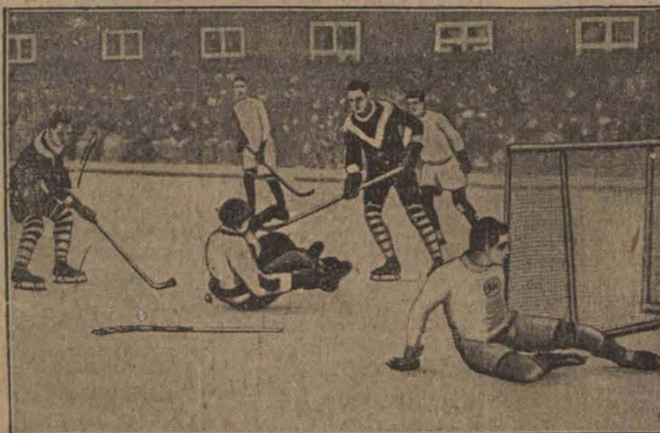
Hokey stał się obecnie niemal tak popularnym sportem zimowym, jak latem piłka nożna.

W niedziele i święta od 9 do 12 w poł. Dla pań oddzielna poczekalnia.