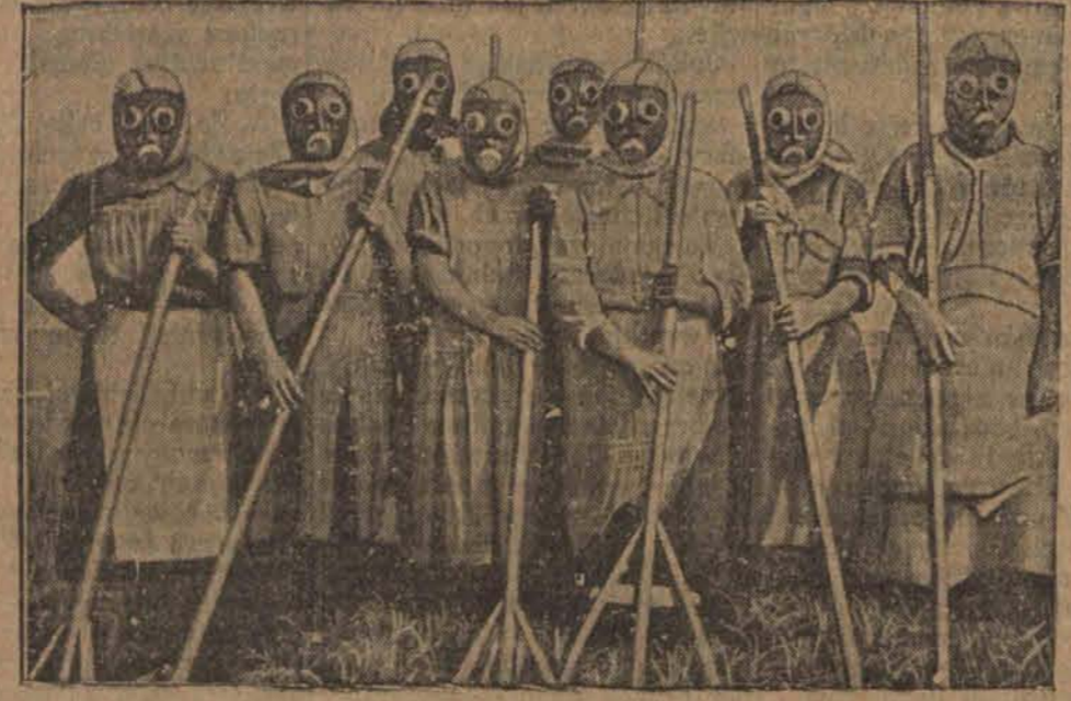
Robotnice dóbr u'rańskich, zajęte pracą przy zbieraniu słomy oraz młoceniu, noszą maski gazowe w celu zapobiegania przedostawaniu się pyłu szkodliwego na płuca.