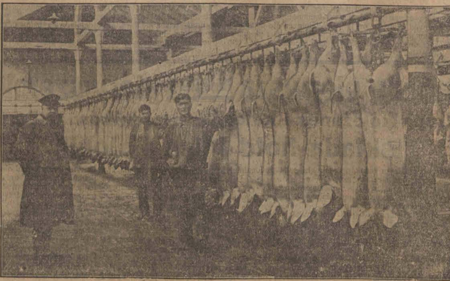
Mięso wieprzowe i świnię żywe stanowią jeden z ważniejszych artykułów eksportowych Polski. Pomimo wojny celnej z Niemcami znaczne ilości polskich świń idą do Niemiec przez Gdańsk. Na ilustracji jedna z hal rzeźni gdańskiej z „towarem” z Polski.