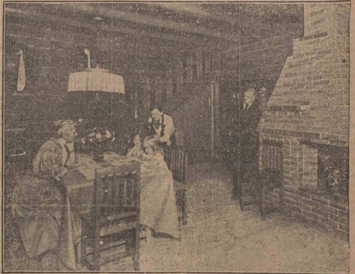
Typowe wnętrze norweskiego domu w okolicach podbiegunowych... Typowe wnętrze norweskiego domu w okolicach podbiegunowych, zbudowanego z grubych bierwion, zaopatrzonego w solidny, dobrze grzejący kominek.