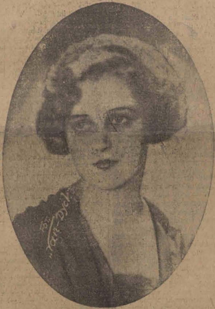
N jnowszo zdjęcie „Miss Polonii”.