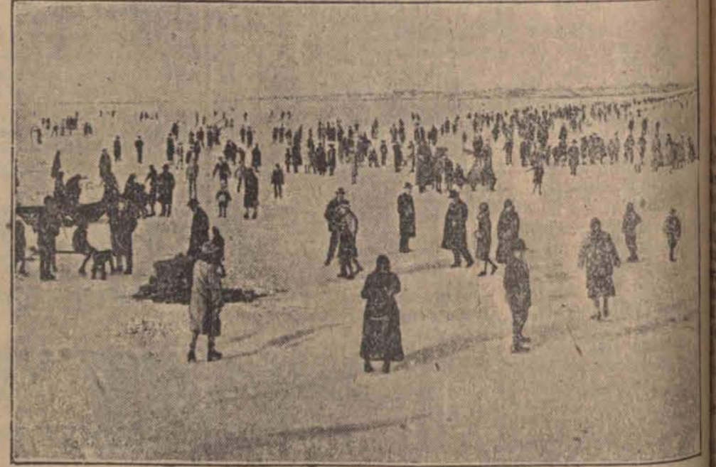
Jezioro Bodeńskie pokryło się w całości grubą warstwą lodu. Ostatni raz miało to miejsce w roku 1812 pamiętnym roku klęski Napoleona w Rosji.