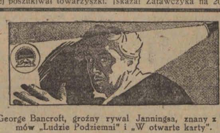
George Bancroft, groźny rywal Janningsa, znany z filmów „Ludzie Podziemi” i „W otwarte karty”.

ROMANTYCZNA PRZEJĄDZKA. Nie jest wprawdzie w czasie obecnych mrozów aktualnym pisać o przejażdżce łódką po juljanowskim stawie, ale ścisłość przedewszystkiem. Opo-