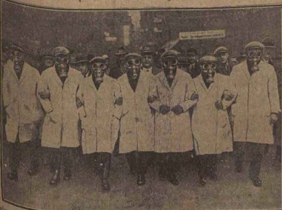
Wiele mówiąca reklama niemieckiej fabryki masek gazowych na ulicach Lipska.