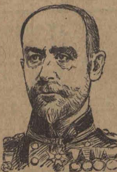
Naczelny admirał floty angielskiej przed wojną światową Sir Edward Seymour, zmarł w Londynie przeżywszy lat 90.