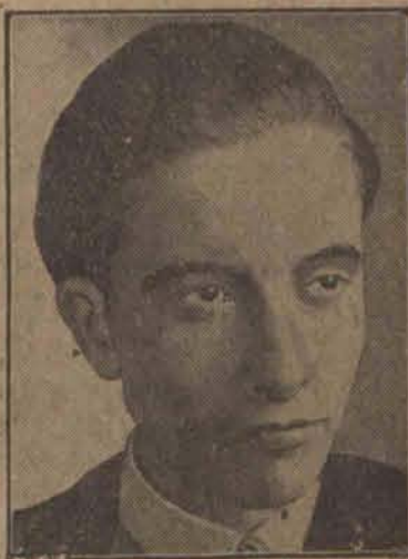
Knickerbocker, znany dziennikarz amerykański wykrył w Berlinie rozgalezioną centralę fałszowania papierów politycznych. (H)