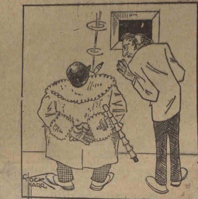
Malarz: - Ten obraz zatytułowalem: „Milość przy księżycu”.