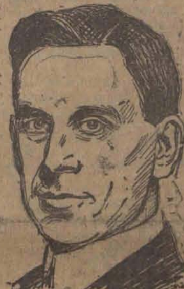
Dr. Ray Wilbur, rektor uniwersytetu w Stanford został mianowany sekretarzem stanu spraw wewnętrznych Unji.