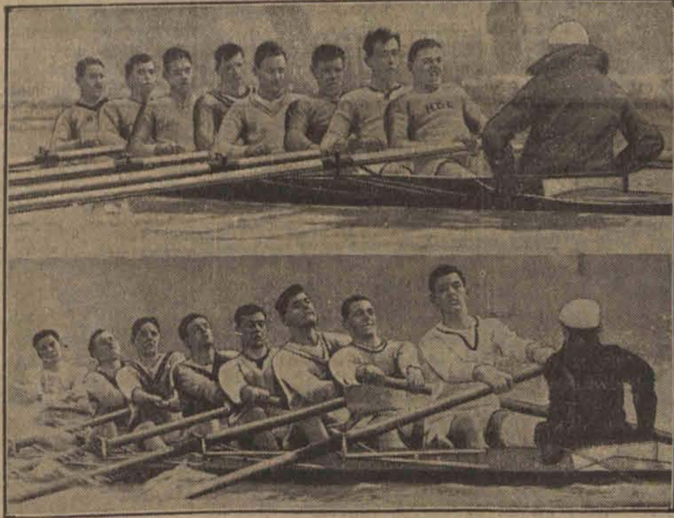
Natychmiast po spłynięciu...