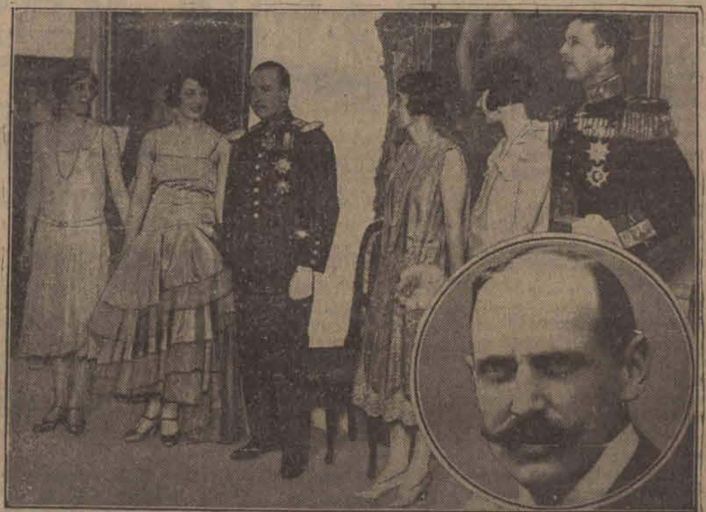
Księżę Olaf w otoczeniu rodziny swej przyszłej żony. W owalu król Norwegii Haakon.