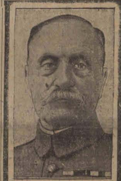
ś. p. Marszałek Ferdynand Foch,

Artykuł ten jest przygrywką do debaty w parlamencie niemieckim o potrzebie subwencjonowania rolnictwa we Wschodnich Prusach, które przeżywa ciężki kryzys rzekomo z powodu korytarza polskiego.