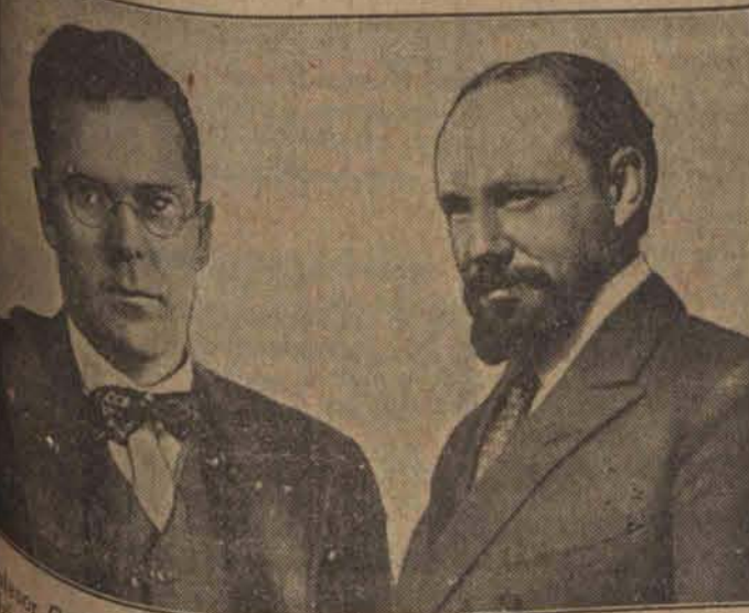
G. P. Putnam i lotnik Wilkins wybierają się latem pod lodem do bieguna północnego.