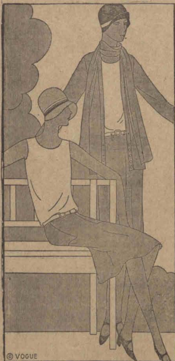
Spódniczka tego kostiumu jest lekko dzwoniąca i wąski pasek. Żakiet uzupełniony długim szalem.