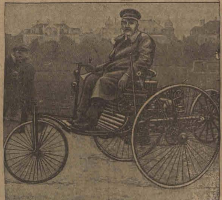
Pierwszy samochód Benza, zbudowany w roku 1885. Jednocylindrowy motor o sile niespełna jednego konia, zmontowany na tylnych kołach, miał tylko jedną przekładnię, ale do zapalania mieszanki służyła już bateria elektryczna. (w)

Łódź, 6 kwietnia. W dniu wczorajszym w składzie manufaktury p. Szottego przy ulicy Słowackiego 14 w Piotrkowie dokonano zuchwałego włamania. Niewykryci dotąd sprawcy przedostawszy się po wylamaniu drzwi do mieszkania p. Szottego, zrobili otwór w murze i weszli do sąsiadującego z mieszkaniem sklepu, skąd zrabowali towaru na sumę przeszło 20.000 złotych. Włamywacze otruli przedtem psa, po czym załadowawszy zrabowany towar na wóz zbiegli nie- spostrzeżeni przez nikogo. Kradzież zauważono dopiero nad ranem. Zaalarmowano policję która wszczęła za zbiegami na tychmiastowy pościg, lecz jak dotąd bezskuteczny. Władze śledcze przypuszczają, że zuchwałej kradzieży dokonali włamywacze łódzcy.