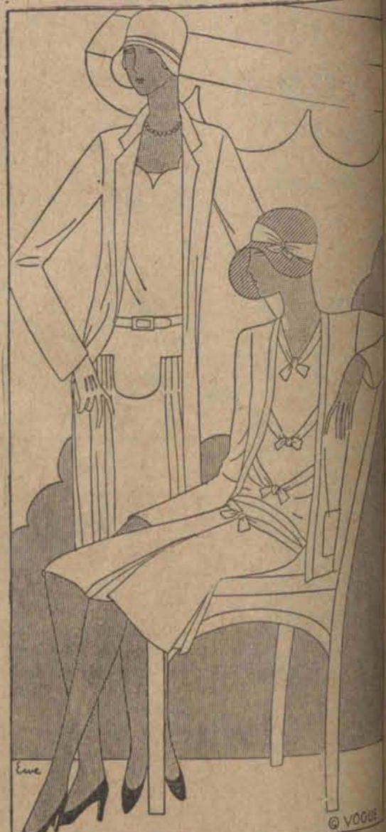
Plaszcz „trzyćwierciowy” i sukienka z „Crepe de Chine”. Sukienka z płótna. Długi żakiet.