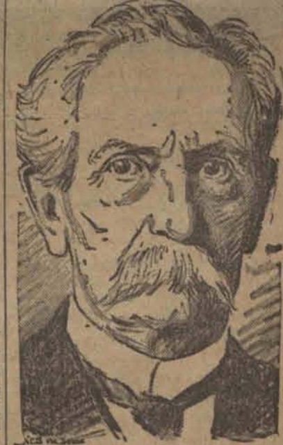
pionier automobilizmu, zmarł przeżywszy lat 84.