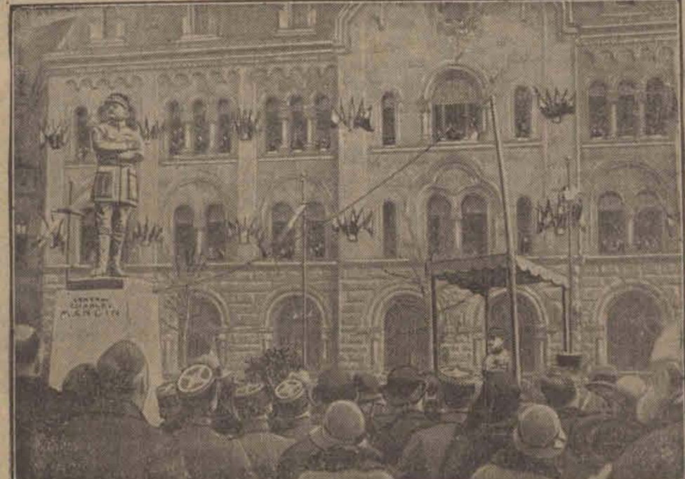
W dawnej twierdzy niemieckiej Metz Francja odsłoniła pomnik generała Mangina. Uroczystości dokonał generał Weygand. (w)