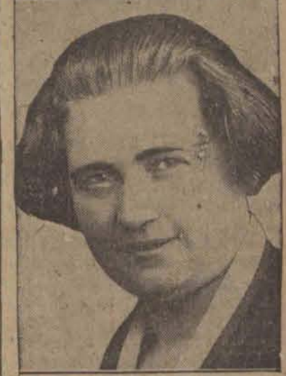
Signorina Rachel Mussolini żona dyktatora Włoch powiła piątego syna. (H)