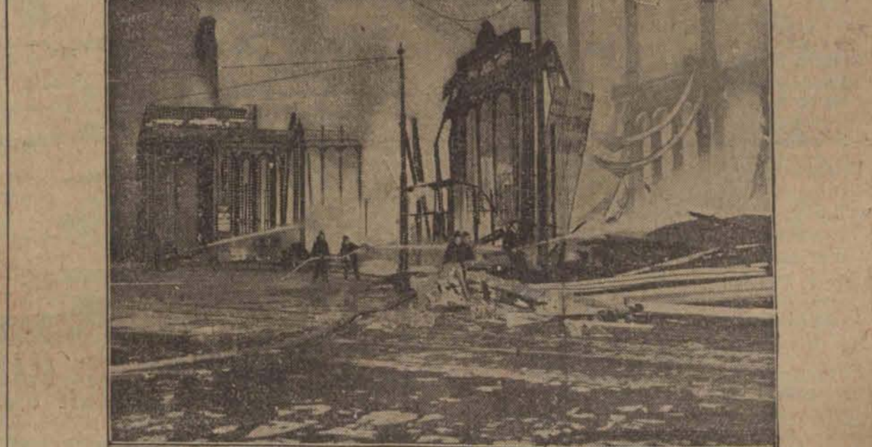
W Amsterdamie spłonął rozległy kompleks budynków, znanych pod nazwą „Palais voor Volksliit” w których prócz kilku restauracji mieścił się największy teatr tego miasta. (w)