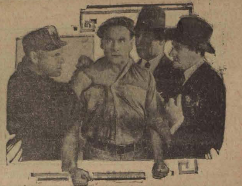
George O'Brien, znany z filmu „Marynarka i blondynki” odtworzył popisową rolę męską w obrazie p.t. „W Kajdach”.