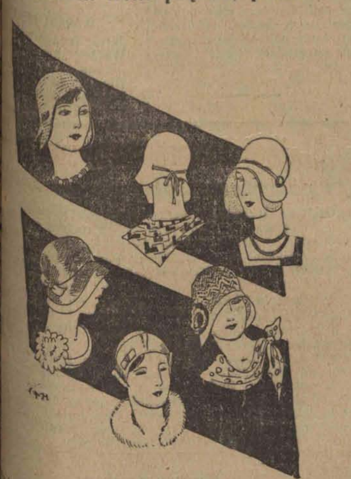
Kolor letniego kapelusza jest ostatnim krzykiem mody.