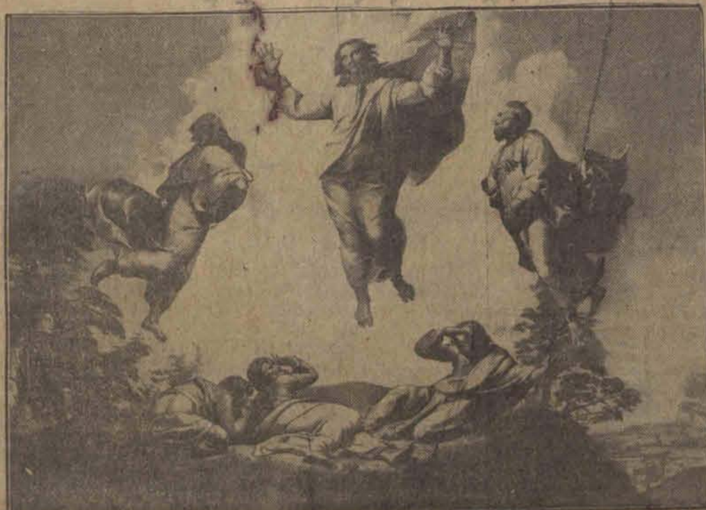
Arcydzieło Raffaella Santi (1483—1520)