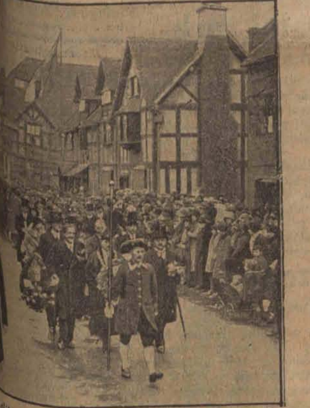
Wieloletni burmistrzowie w Somersie w Anglii.