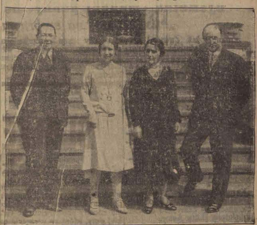
B. rumuński minister spraw zagranicznych Titulescu, delegat Rumunii w Genewie odbywa obecnie podróż propagandową po Europie.