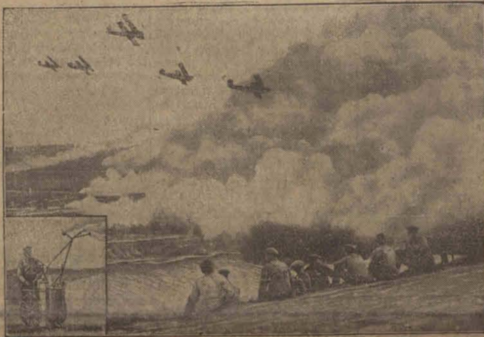
pod Królewcem w czasie silnej mgły. W czworokacie na lewo aparat rozpraszający mgły.