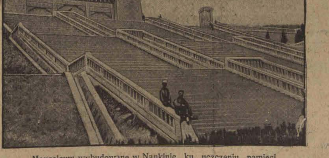
Mauzoleum wybudowane w Nankinie ku uczczeniu pamięci Sunjatsena (1863 — 1925) prezydenta republikańskiego południowych Chin (1911 r.), który pierwszy położył kamień węgielny do wyzwolenia narodowego.