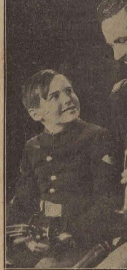
Fragment z pożegnalnego filmu Jackie Coogana p. t. „W obrotach kobiet“...

wobec uwagi aczkolwiek dyskretnej kelnera i obecności tylu innych par — zmusza ich do