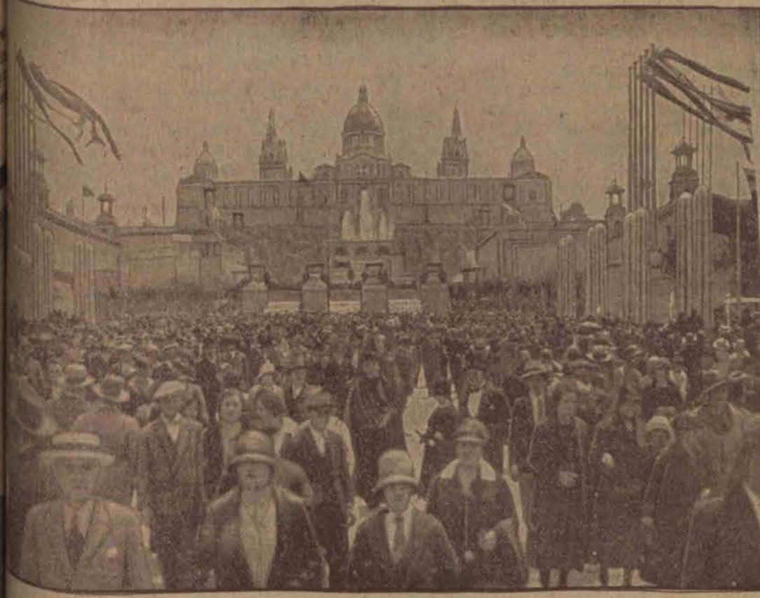
Dowodem tego jest tłum ludzi defilujących przed pałacem narodowym.