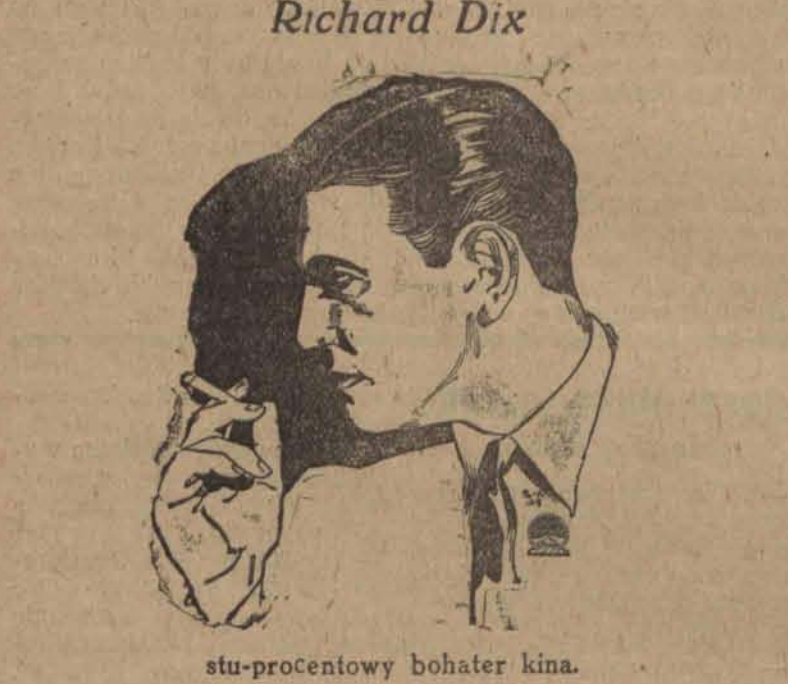
Richard Dix — stu-procentowy bohater kina.

Inni stenografowie Białego Domu pracują sycitali, a wręczają dyktaty następnego dnia. Za prez. Wilsona pracowano wydawniczo w Białym Domu lecz nigdy jeszcze nie panował tam tak piekielny ruch, jak za Hoovera, który jest istnym demonem pracy . Ma on coprawda rzeczywiście sporo do załatwienia. Z początkiem miesiąca mają przybyło aż 5 tys. listów, skierowanych do samego prezydenta.