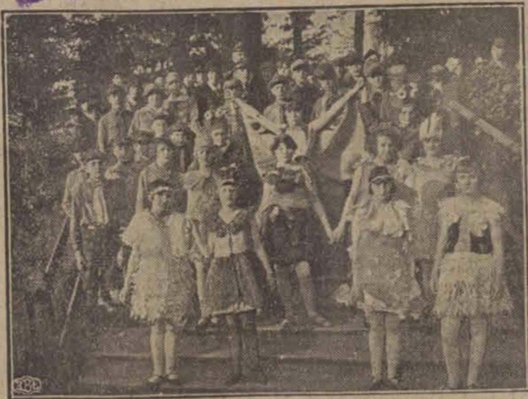
wykonany przez miłutkie harcerekki łódzkie na zabawie ogrodowej w Helenowie na rzecz kolonij letnich.