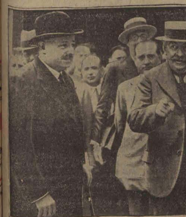
Wszyscy europejscy politycy. Na zdjęciu, Briand w towarzystwie ambasadora hiszpańskiego i japońskiego posła.