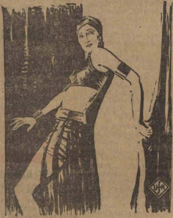
w swoim wschodnim tańcu jest obecnie największą sensacją kabaretów Londynu