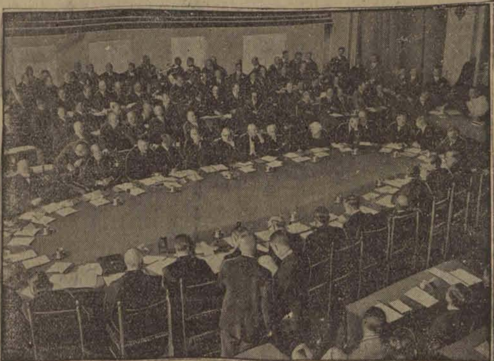
Odczytanie mowy powitalnej przez holenderskiego ministra spraw zagranicznych Blacklanda (na prawo przy oddzielnym stole.)