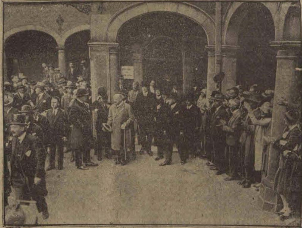
Członkowie konferencji opuszczają pierwsze posiedzenie.