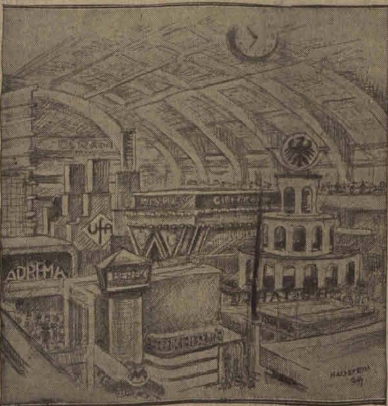
Jedna z hal wystawowych.