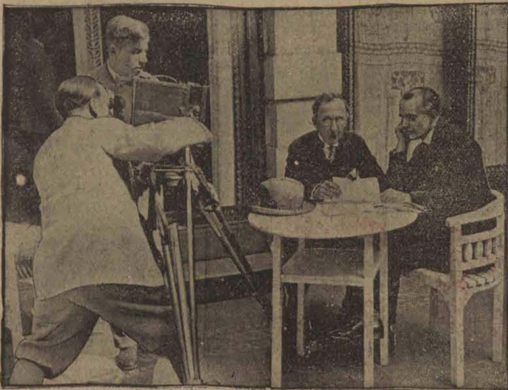
Kierownik zeszłorocznej ekspedycji „Itali“ na biegun północny general Nobile, który pisze na ilustracji widzimy go (po prawej stronie) obok słynnego aeronauty, profesora Bersonia.