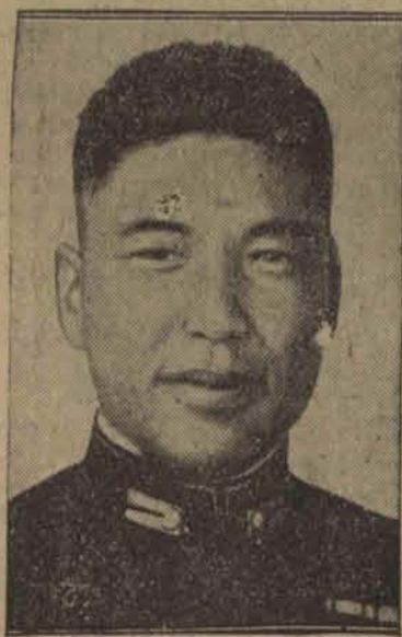
Kapitan japońskiej marynarki brał udział w locie do Tokio. Łączy się to z planem zakupienia sterowca przez Japonię.