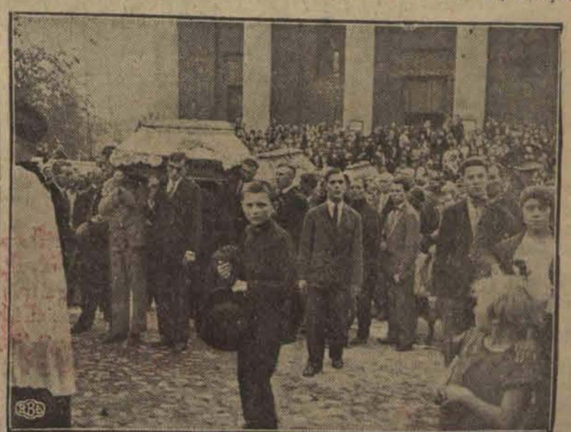
Tępy trumny na barkach kolejarzy-kolejarzy.