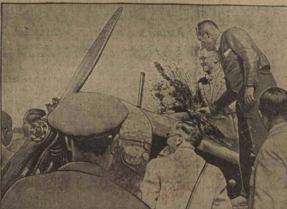
Na lotnisku Orly pod Paryżem specjalny komitet witał przybywających lotników wręczając im kwiaty i nagrody. [17]