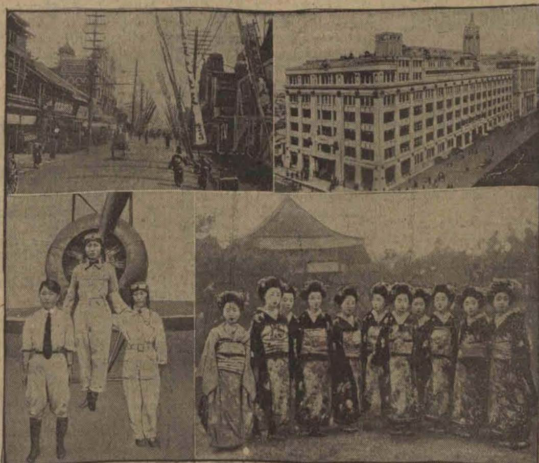
Z życia japońskiego umie doskonałe pogodzić postęp z tradycją. — Tokio jest miastem dziwnych kontrastów. U góry widzimy po lewej stronie typową japońską ulicę. Po prawej: Nowoczesny dom towarowy. Po lewej stronie u dołu: Lotniczeki japońskie; po prawej: Gejsze przed herbacziarnią. (h)