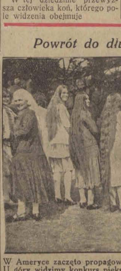
W Ameryce zaczęto propagować powrót do długich włosów. U góry widzimy konkurs piękności długich włosów, aby zachęcić panie do naśladownictwa.