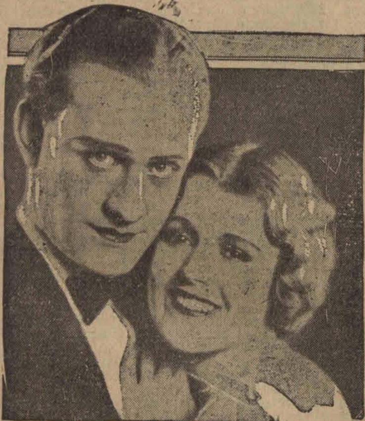
Sliczna para kochanków filmowych, Lonrad Najel i June Collyer w obrazie „Słodczy grzechu”.