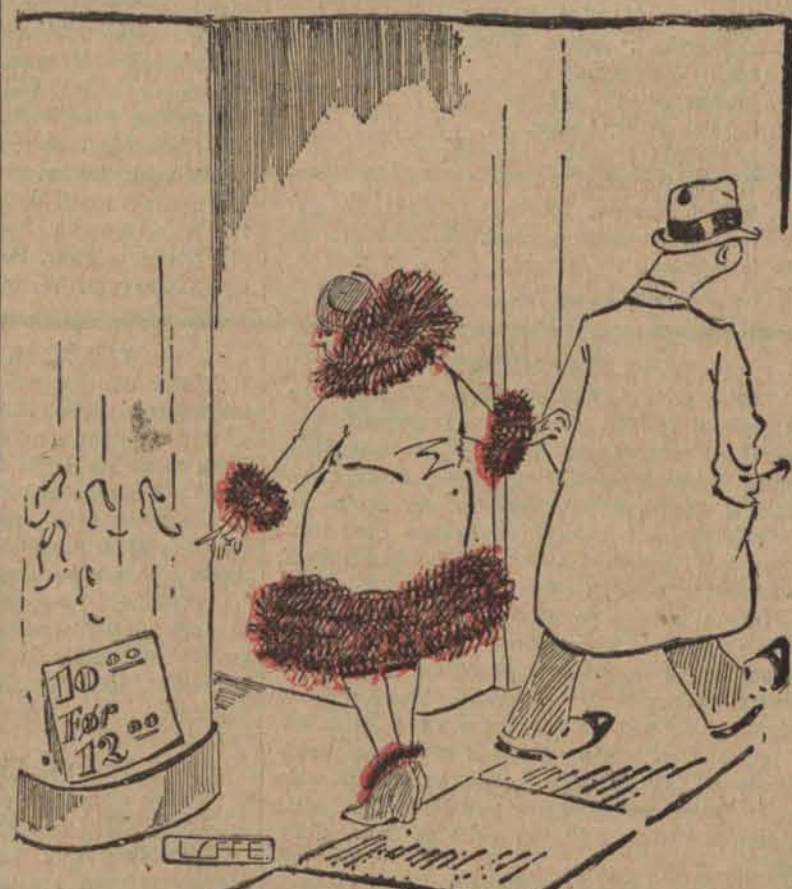
Najlepiej omijać wystawy z zimną pogardą.

Za wydawnictwo odpowiada: Władysław Stypułkowski. Za redakcję odpowiada: Roman Furmański.