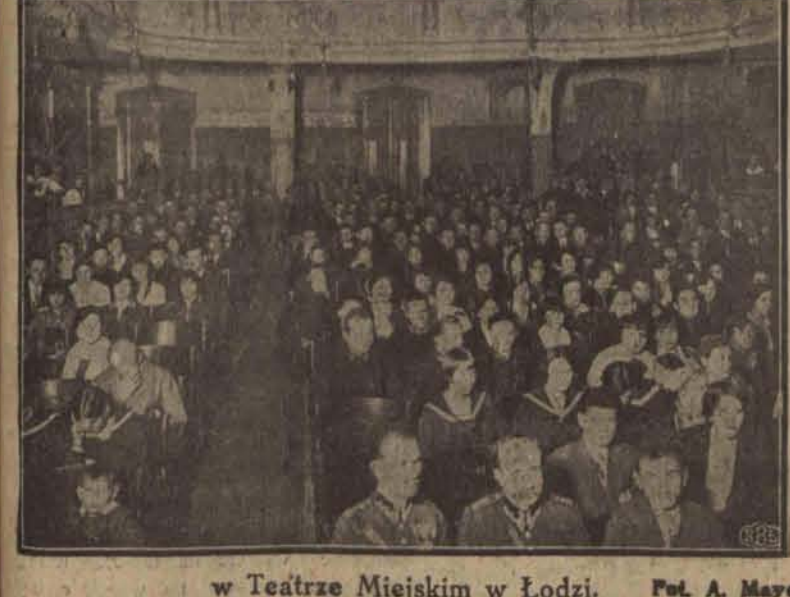
w Teatrze Miejskim w Łodzi.