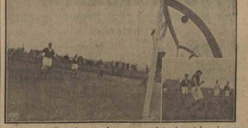
Silny strzał Pazurka z trudem odbija bramkarz Fioletowych Michał Smoczka przy piłce.