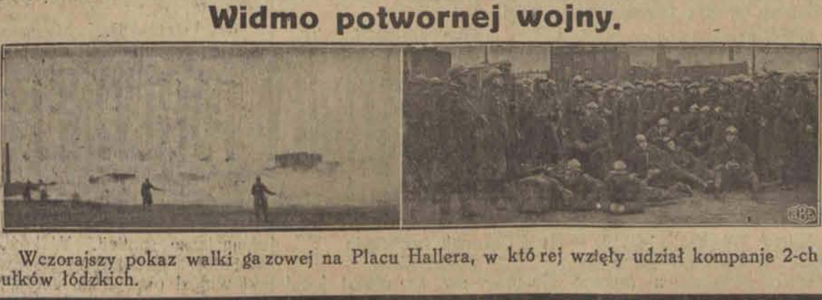
Wczorajszy pokaz walki gazowej na Placu Hallera, w której wzięły udział kompanie 2-ch pułków łódzkich.

warzystwie pułkownika Rayskiego zwiedził szkołę i składy lotnicze w Deblinie oraz fabrykę samolotów w Lublinie. Generał Simowic zaprosił do Belgradu kapitana Orlińskiego, celem zademonstrowania na miejscu samolotu polskiej konstrukcji, który przewyższa swymi zaletami najnowsze aparaty myśliwskie Francji, Anglii i Czechosłowacji.