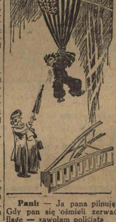
Pań: - Ja pana pilnuję. Gdy pan się ośmieli zerwać flagę - zawołam policjanta