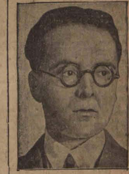
Tegoroczną nagrodę Goncourtów, — najwyższe odznaczenie literackie Francji, otrzymał młody powieściopisarz Marcel Aymon.