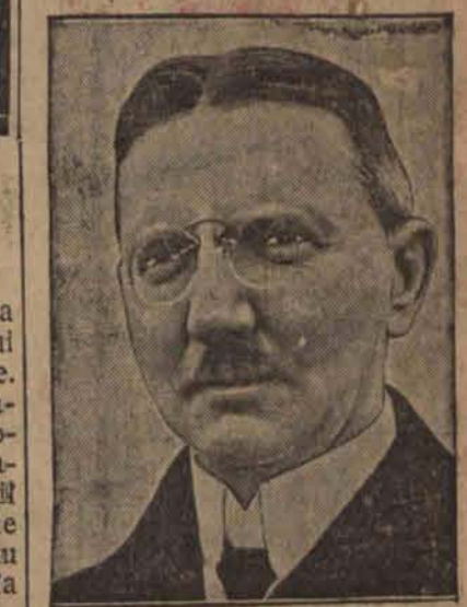
DR. SCHACHT, prezydent Banku Rzeszy ogłosił memoriał przeciwko planowi Younga, który wywołał olbrzymią konsternację w tonie niemieckiego rządu. (w)