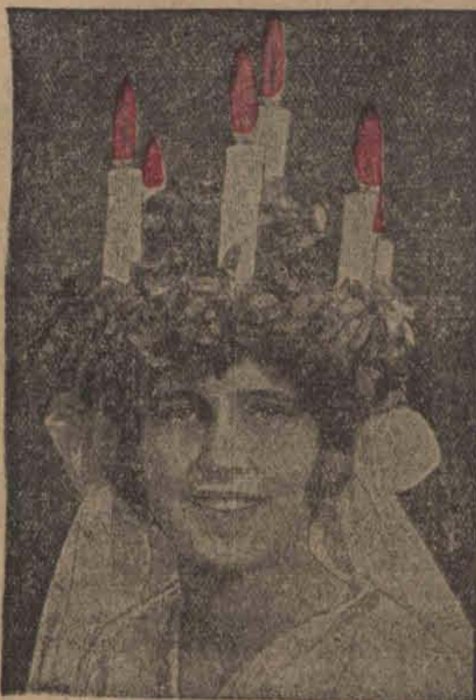
W Szwecji zachował się ciekawym zwyczaj, ubierania w wianiec z świecami (y) żyłki głowy najmłodszej córki