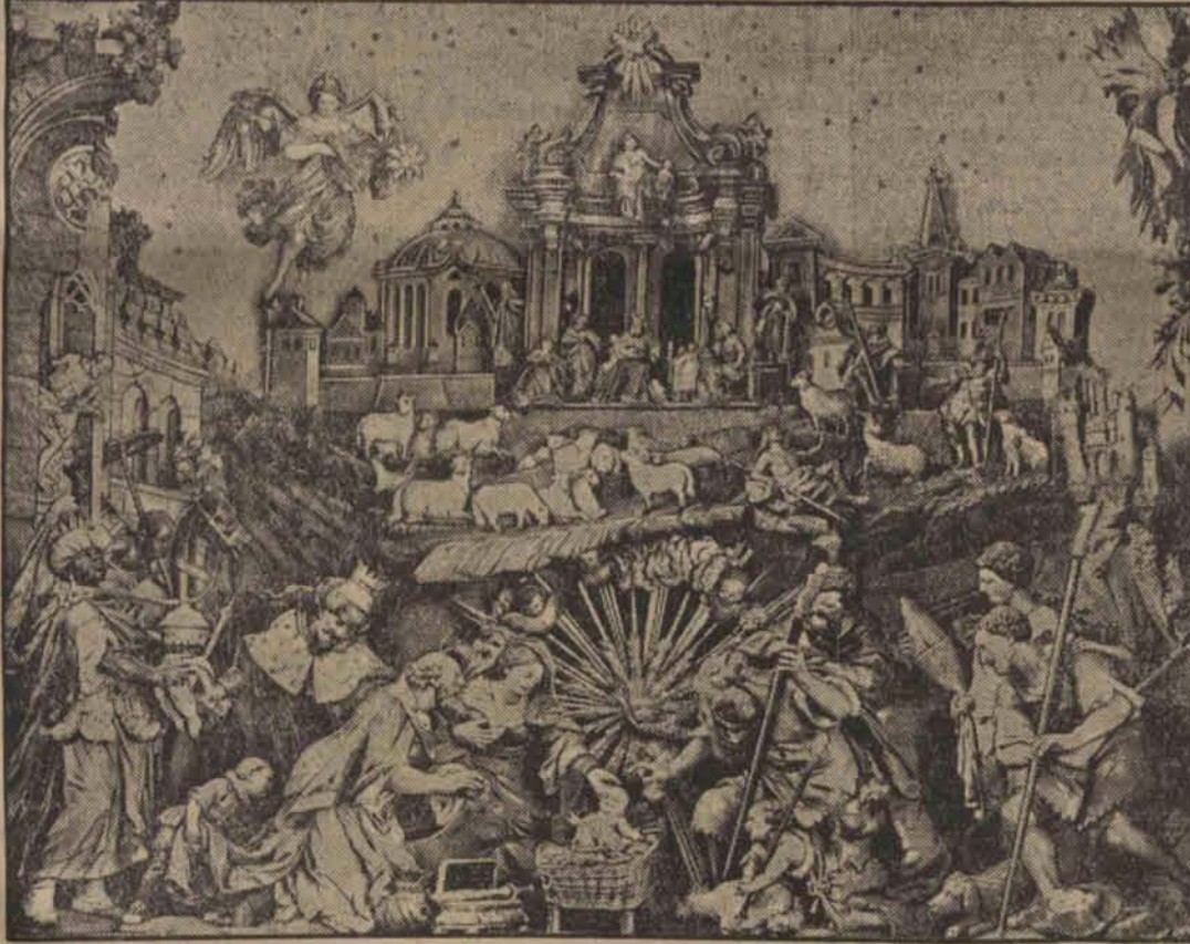
Pierwowzoru znanej szopki krakowskiej należy doszukiwać się w t. zw. szopce norymberskiej której wspaniały okaz został zachowany w muzeum miejscowym.