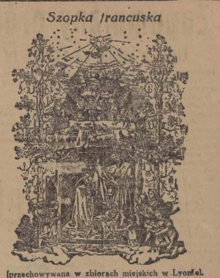
(przechowywana w zbiorach miejskich w Lyonie)

Komunikacja powietrzna dzięki swej szybkości oddawać może specjalnie duże usługi wydawnictwom czasopism, gdyż dzięki niej pisma dostają się do najbardziej nawet odległych miejscowości w ciągu krótkiego czasu, nie tracąc na aktualności. Wielkie wydawnictwa zagraniczne oceniają tę doniosłą rolę lotnictwa, żywo interesując się jego rozwojem i biorąc udział w jego organizacji. W Genewie odbyła się konferencja Miedzynarodowego Zrzeszenia Towarzystwa Komunikacji Powietrznej (International Air Traffic Association) z udziałem przedstawicieli największych firm wydawniczych. Tematem konferencji był powietrzny przewóz czasopism i dwa zasadnicze problemy tj. kwestja uniżenia opłat przewozowych oraz kwestja zrzucańcia czasopism z samolotów. Odnosność do pierwszej kwestji osiągnięto porozumienie, u-