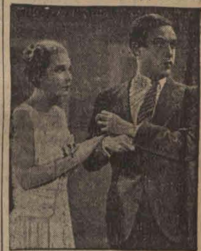
gra ją w arcydziele Langa p. t. „Kobieta na księżycu”.