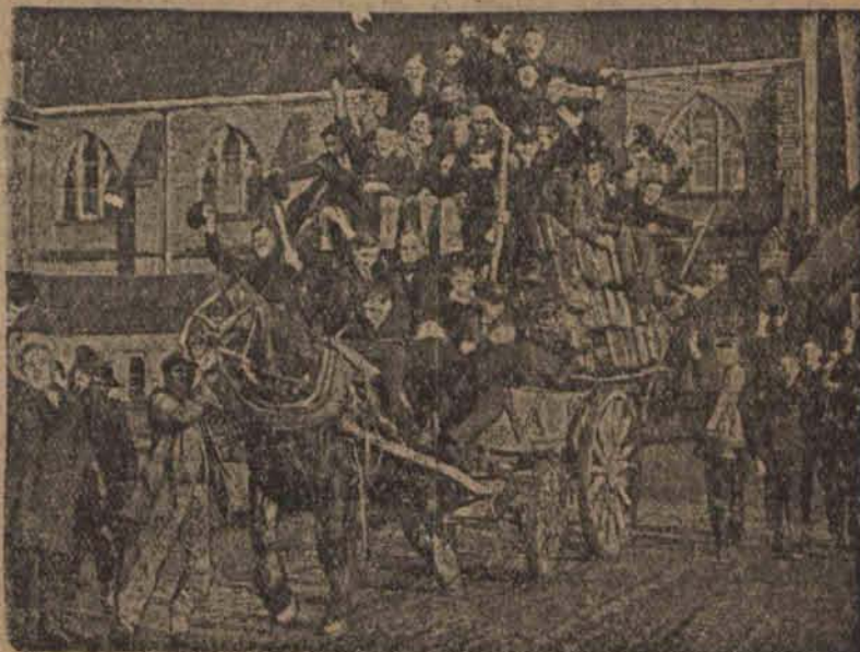
Wesoły odjazd uczniów anielskich na ferie świąteczne.

W UROCZY TYM DNIE, TAK DROGIM SERCU KAŻDEGO POLAKA, WSZYSTKIM PRENUMERATOROM, CZYTELNIKOM ORAZ SYMPATYKOM, NASZEGO PISMA SKŁADA SERDECZNE ŻYCZENIA „WESOLYCH ŚWIAT”