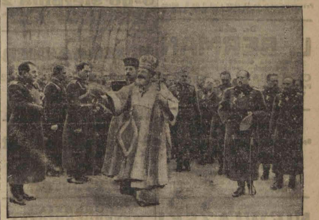
Metropolita Stefan udzielił wojsku bułgarskiemu z carem Borysem na czele, do-rocznego błogosławieństwa.