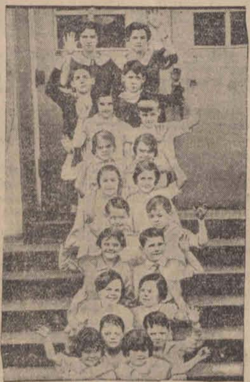
Do szkoły w Atlanta (St. Zjedn.) uczęszcza dziesięć par bliźniaków.