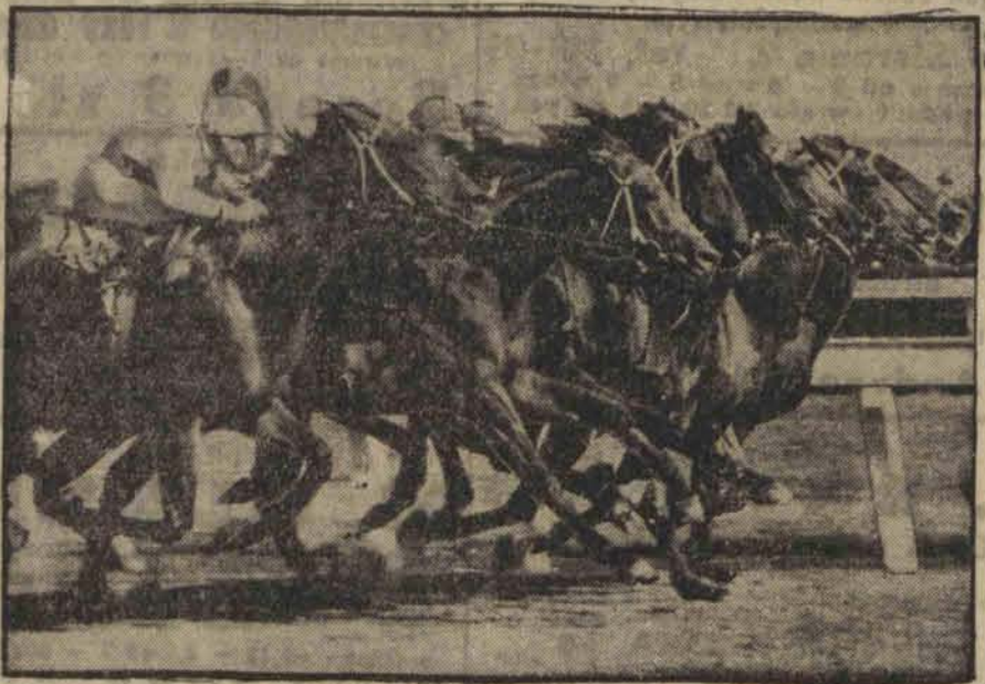
Ciekawe zdjęcie z angielskiego toru wyścigowego, tuż przed celownikiem.