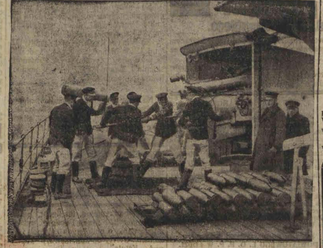
Oficerowie angielskiej marynarki wojennej odbywają w grupach po 100 kolejno ćwiczenia w strzelaniu z nowych dział na okręcie ćwiczebnym „Caracoa”.