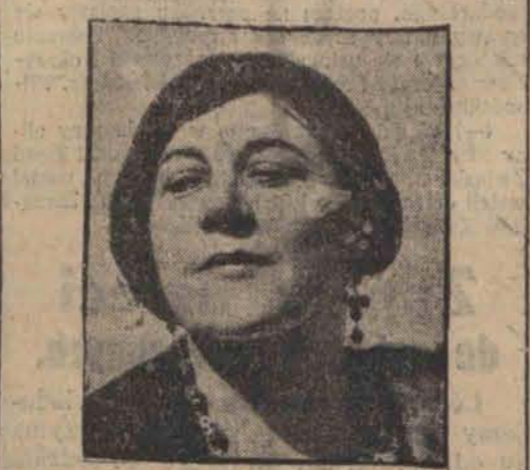
Świątowej sławy śpiewaczka Sigrid Onegin, została mianowana honorowym doktorem uniwersytetu w Filadelfii.