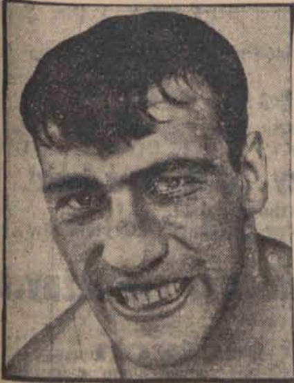
Primo Carnera po swoim zwycięstwie w Miami.