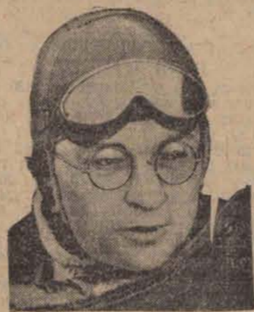
Wolf Hirth przeleciał w szybowcu 265 km. z Buenos Aires do Rosario, ustanawiając nowy rekord światowy.

„Zorganizowanym i przygotowanym do obrony przeciwlotniczo-gazowej nic grozić nie będzie! Czy jesteś już członkiem L.O.P.P.?”