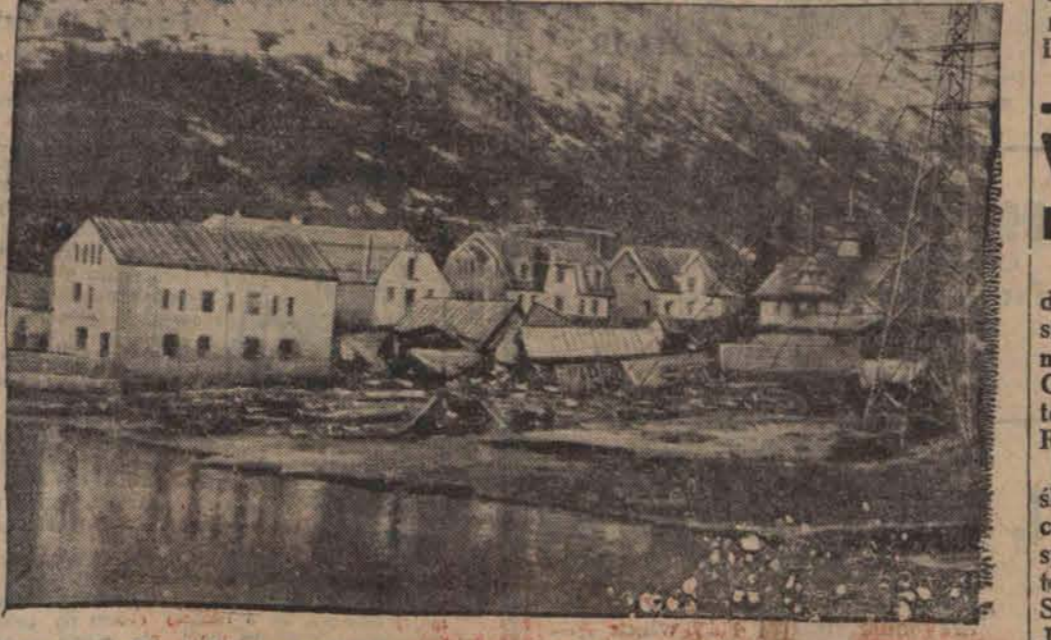
Wioska Tafford, która wskutek zwałenia się do zatoki olbrzymiej skały została na kilka minut zalana olbrzymią falą. Po ustąpieniu wody zostało 40 trupów.