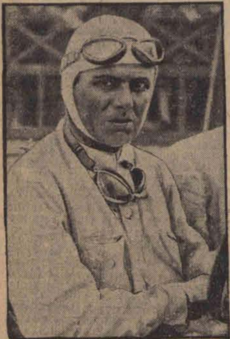
Włoch Varzi zwyciężył w słynnym raidzie samochodowym „1000 mil” na trasie: Brescja-Rzym-Brescja z przeciętną szybkością 115,5 klm. na godzinę.