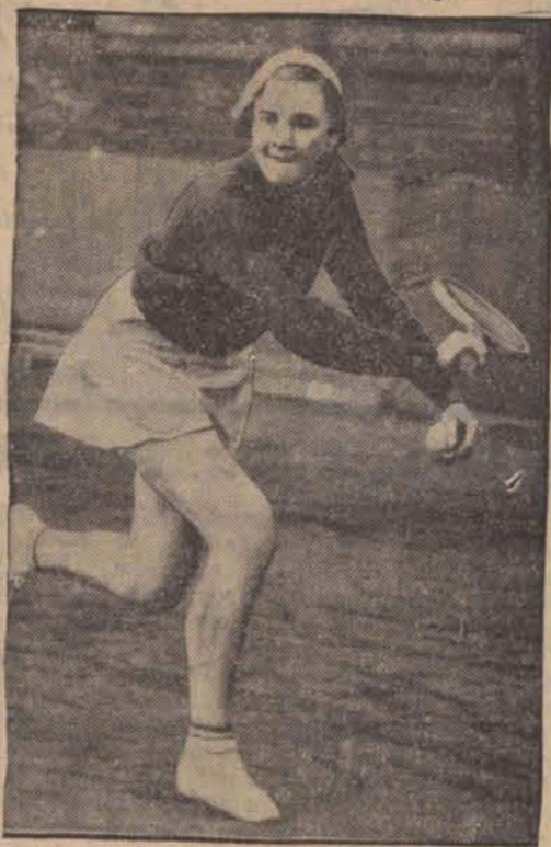
Spółniczki zawodniczek tenisowych w Paddington (Anglia) są zapewne bardzo praktyczne, ale niezbyt... estetyczne.