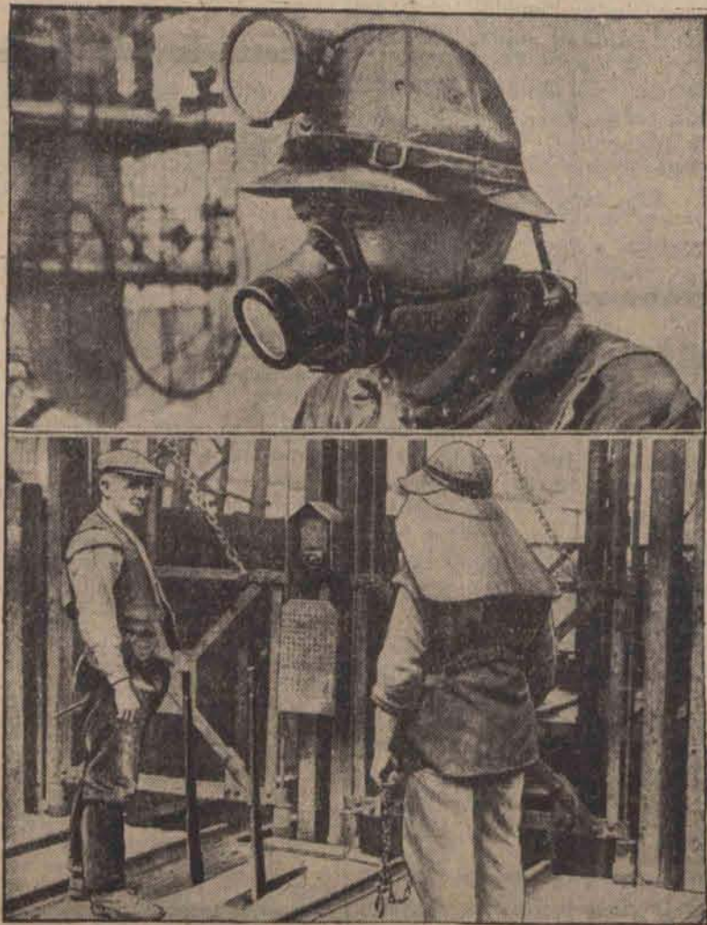
Podczas budowy olbrzymiego mostu przez Zatokę Złotą w Kalifornii zastoso- wano po raz pierwszy hełmy, chroniące głowę przed spadającymi nitami oraz maski gazowe przeciwko gazom ołowiu podczas uszczelniania rur i przewodów.