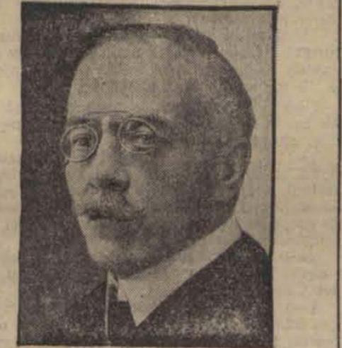
b. kanclerz związkowy Szwajcarii, zmarł w wieku 63 lat w Bernie.