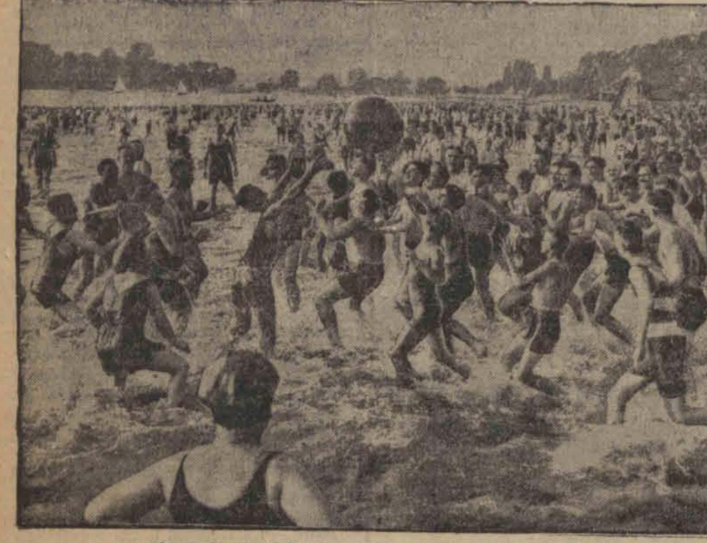
nie psuje absolutnie wesołego nastroju na plaży.