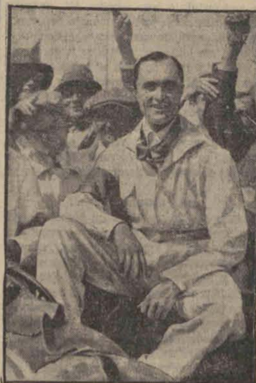
na Alfa Romeo o Nagrodę Francji.