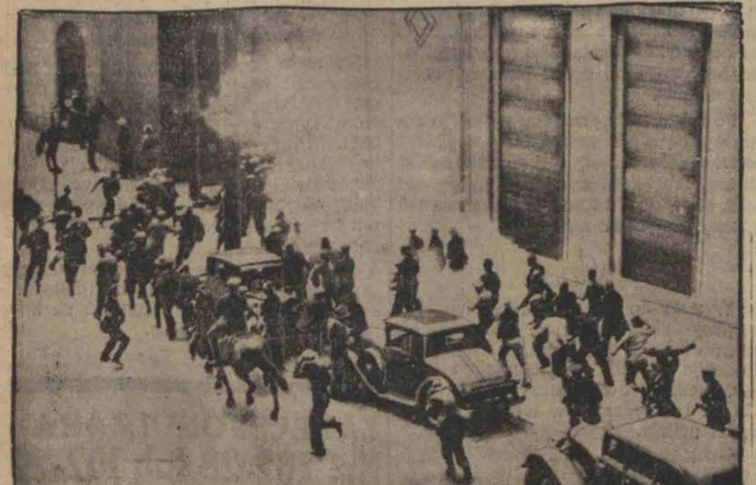
Moment rozpędzania demonstrantów gazem izawiacym.