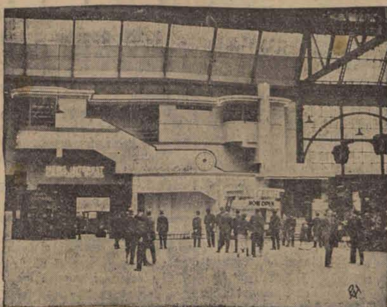
Na dworcu kolej. Waterloo znajduje się kinoteatr, obliczony na 250 osób. Jest to niewątpliwie inowacja w Europie. Na zdjęciu — hala dworca londyńskiego z lewej strony wejście do kina