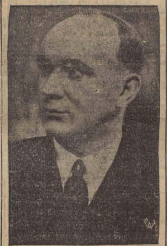
Prezydent Senatu w m. Gdańska przybył do stolicy z oficjalną wizytą.