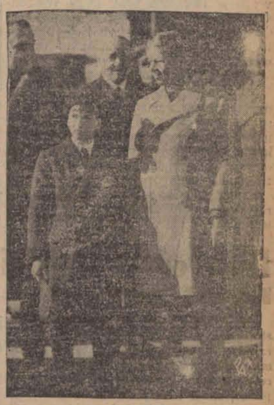
W tych dniach przybył do Białogrodu rumuński następca tronu ks. Michał. — Zdjęcie przedstawia ks. Michała na dworcu w Białogrodzie w towarzystwie przybyłego na powitanie młodocianego króla Pietra II.