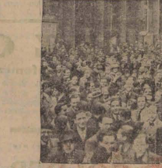
W Paryżu doszło w tych dniach do strajku studentów wydziału medycznego tamtejszego Uniwersytetu, na tle ograniczenia praw studentów cudzoziemców. — Na zdjęciu — demonstracja studentów przed gmachem wydziału lekarskiego.