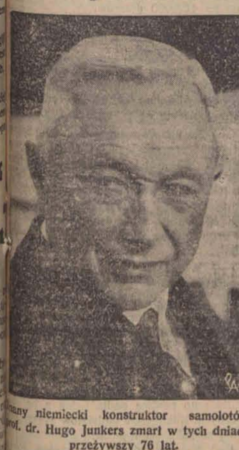
Hugo Junkers zmarł w tych dniach przeżywszy 76 lat.