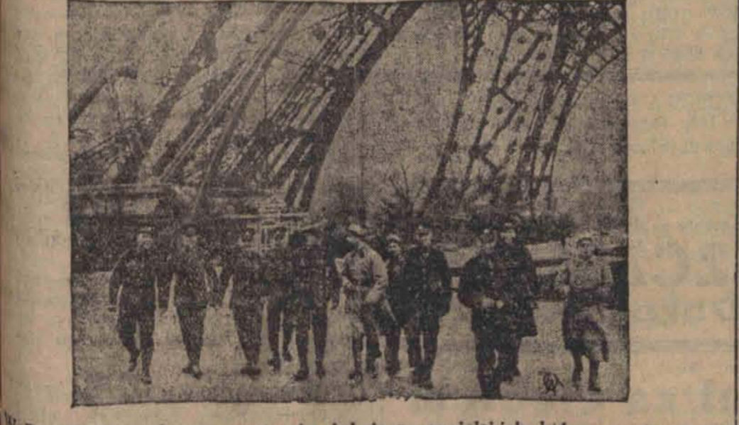
W Paryżu bawi obecnie wycieczka żołnierzy angielskich, którzy w towarzystwie swych francuskich kolegów zwiedzają najciekawsze objekty tego miasta. Na zdjęciu widzimy wycieczkę u stóp wieży Eiffela.