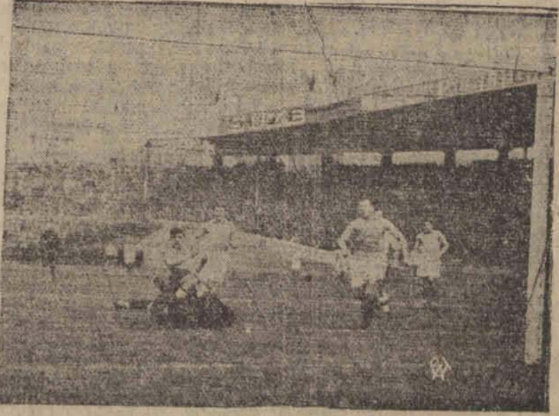
W tych dniach odbył się w Paryżu międzynarodowy mecz piłki nożnej Francja — Niemcy, zakończony zwycięstwem Francji w stosunku 3:1. Na zdjęciu — moment meczu.