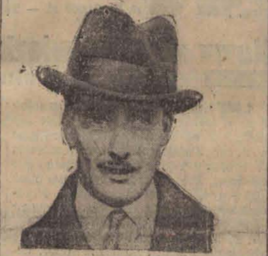
Dzisiaj przybywa z Moskwy do Warszawy p. Anthony Eden, lord - strażnik prywatnej pieczęci, celem odwołania z rządem polskim aktualnych zagadnień politycznych.