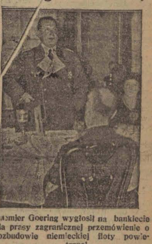
Patmjer Goering wygłosił na bankiecie dla prasy zagranicznej przemówienie o rozbudowie niemieckiej floty powietrznej.