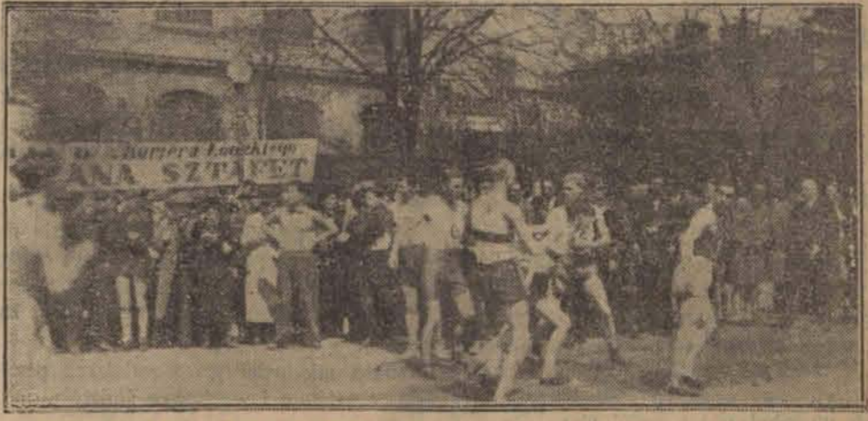
W niedzielę odbył się w Parku Poniatowskiego doroczny bieg sztafetowy L.O.Z.L.A. o nagrodę „Kurjera Łódzkiego“.