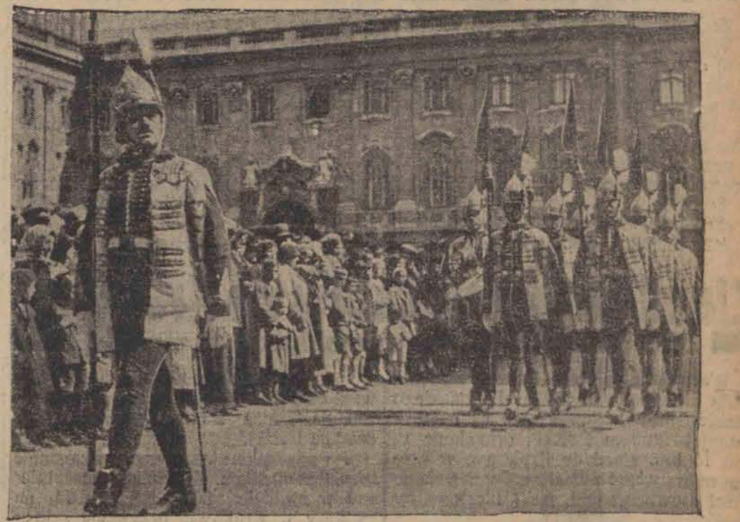
W Budapeszte zachowała się z dawnej świetności gwardja Korony św. Szczepana, która pełni rolę przy skarbcu koronacyjnym na zamku królewskim. Przemarsz wartty obserwują tysięczne tłumy.